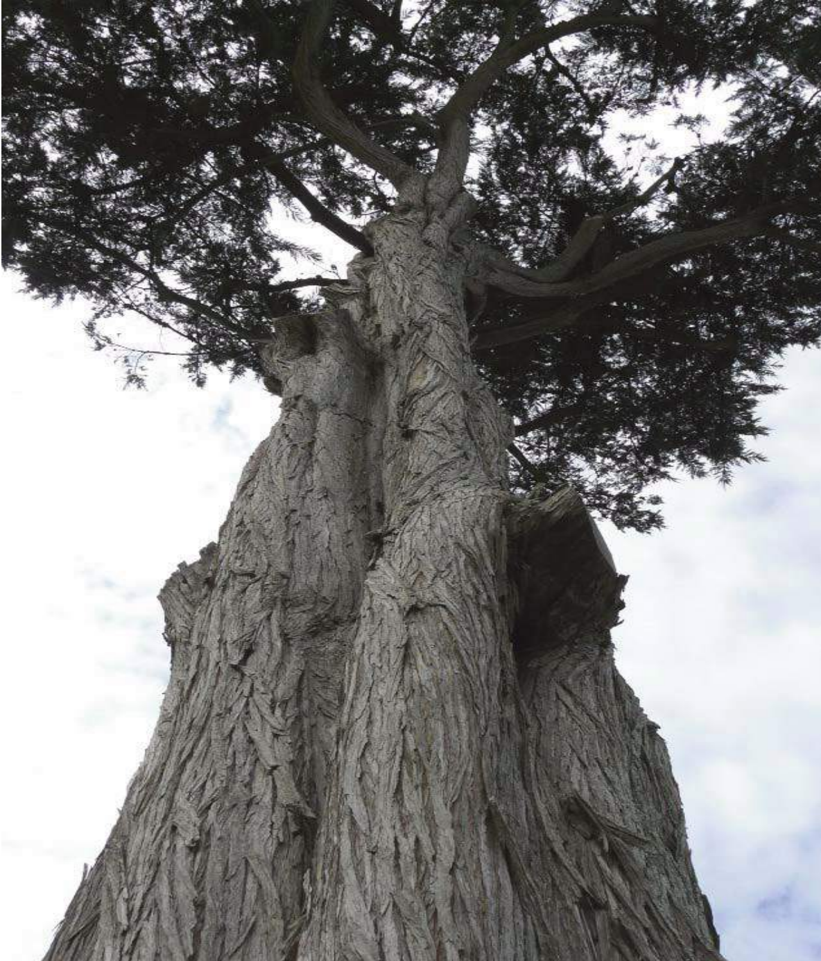
Cyprès de Lambert